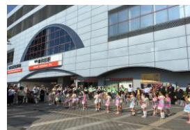
マーチング活動 (赤い羽根共同募金オープニング)