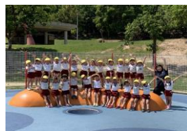
とんぼ池公園へのピクニック