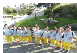
秋の遠足 (白浜アドベンチャーワールド)